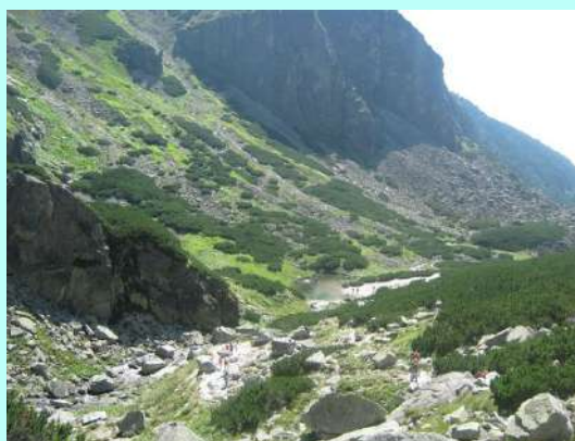
Malo jezero sa plažom