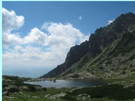
Jezero iznad vodopada