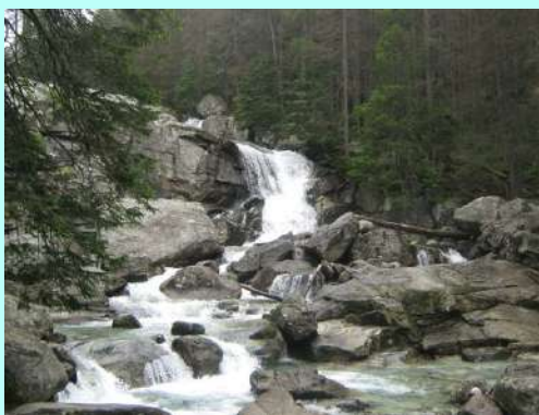
Vodopadi na Studenom potoku