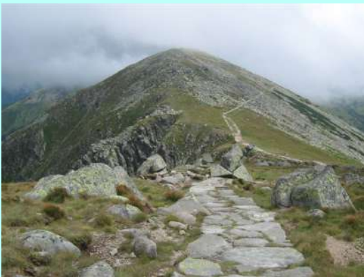
Kao na Terazijama – greben ka Đumbijeru

Žurimo da se svi slikamo. Na vrhu se nalazi i ploča koja pokazuje tačnu udaljenost glavnih gradova od Hopoka. Tu je i Beograd, naravno. Vazdušnom linijom udaljen 485 km! Da je lepo vreme, videli bismo, kao na dlanu, sve vrhove Visokih Tatri, poređane kao biseri u ogrlici. Ne žalimo, doći ćemo ponovo...mislimo u sebi. Vraćamo se nazad, u Kamenu hatu, koja je, inače, otvorena za planinare tokom cele godine, a odakle, nakon kraće pauze, nastavljamo grebenom ka drugom vrhu. Magla i oblaci delimično se podižu, pa opet imamo divne poglede sa grebena, ka dolinama na obe strane. Planinarska staza koja vodi celom njegovom dužinom zaista je pravo remek-delo. I stvarno, kako reče Rađa, kao da hodate Terazijama...Pogledajte sliku. Sa Hopoka smo se spustili skoro 300 metara do prevoja Demanovske sedlo (1756m), a onda nastavili dalje uspon preko grebena, do Đumbijera. Na samom vrhu, postavljena su dva velika krsta posvećena nastradalim planinarima. Nažalost, zbog oblaka u kome smo bili, ni sa ovog vrha nismo imali poglede.