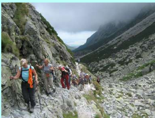
Staza ka Zbojničkoj hati

Zaustavljamo se, fotografiramo, napajamo oči i dušu tom lepotom...Kroz šumu, stižemo i do najstarijeg planinarskog doma „Rainerova chata“, sagrađenog 1863. godine. Kasnije saznajemo da su besprekorno uređene planinarske staze, sa složenim ravnim kamenjem i pločama, kao pravim, velikim mozaicima („kao na Terazijama“, kako reče Rada), upravo delo učesnika omladinskih radnih akcija u 19. veku! Tu se rastajemo sa planinarima - šetačima. Oni ostaju da piju kafu u tom domu, da u povratku još malo slikaju vodopade, da se vrte do Hrebionika i spuste vozom u Stari Smokovec, gde će provesti ostatak dana, do našeg povratka. Mi ulazimo u Veliku Studenu dolinu. U početku, oblaci i magla zaklanjaju okolne grebene i vrhove...Osećamo da je sunce tamo negde, ali ga ne vidimo. A onda, polako pred nama počinje ta večita igra sunca i oblaka...ko će nadvladati. U jednom trenutku zastajemo i fotografiramo vrhove grebena koji, kao pobednici, izranjaju iz oblaka i magle, obasjani suncem, sa plavim nebom u pozadini. Sa oduševljenjem ih pozdravljamo. I ova staza je zanimljiva.