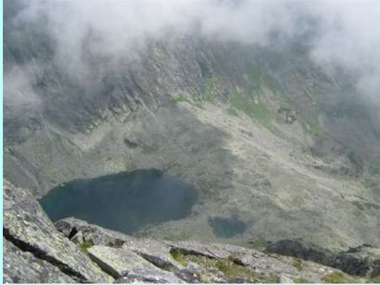
Krivansko Zeleno pleso