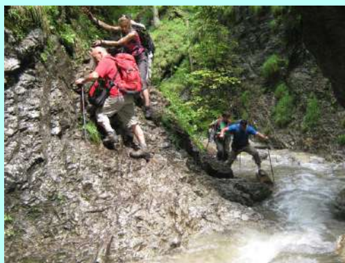
Snalaženje na nabujaloj reči