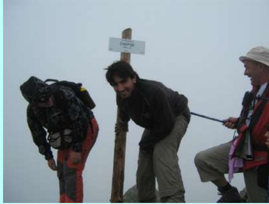
Krštenje na Hopoku

Žurimo da se svi slikamo. Na vrhu se nalazi i ploča koja pokazuje tačnu udaljenost glavnih gradova od Hopoka. Tu je i Beograd, naravno. Vazdušnom linijom udaljen 485 km! Da je lepo vreme, videli bismo, kao na dlanu, sve vrhove Visokih Tatri, poređane kao biseri u ogrlici. Ne žalimo, doći ćemo ponovo...mislimo u sebi. Vraćamo se nazad, u Kamenu hatu, koja je, inače, otvorena za planinare tokom cele godine, a odakle, nakon kraće pauze, nastavljamo grebenom ka drugom vrhu. Magla i oblaci delimično se podižu, pa opet imamo divne poglede sa grebena, ka dolinama na obe strane. Planinarska staza koja vodi celom njegovom dužinom zaista je pravo remek-delo. I stvarno, kako reče Rađa, kao da hodate Terazijama...Pogledajte sliku. Sa Hopoka smo se spustili skoro 300 metara do prevoja Demanovske sedlo (1756m), a onda nastavili dalje uspon preko grebena, do Đumbijera. Na samom vrhu, postavljena su dva velika krsta posvećena nastradalim planinarima. Nažalost, zbog oblaka u kome smo bili, ni sa ovog vrha nismo imali poglede.